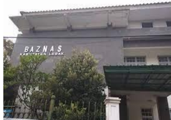
Gambar 4.1 Logo BAZNAS Kabupaten Lebak

Jenis Entitas : Lembaga Pemerintah Non Struktural